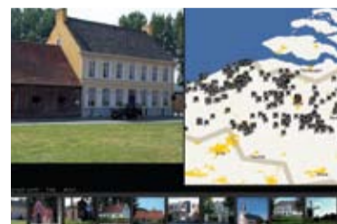
De website van erf-goed.be