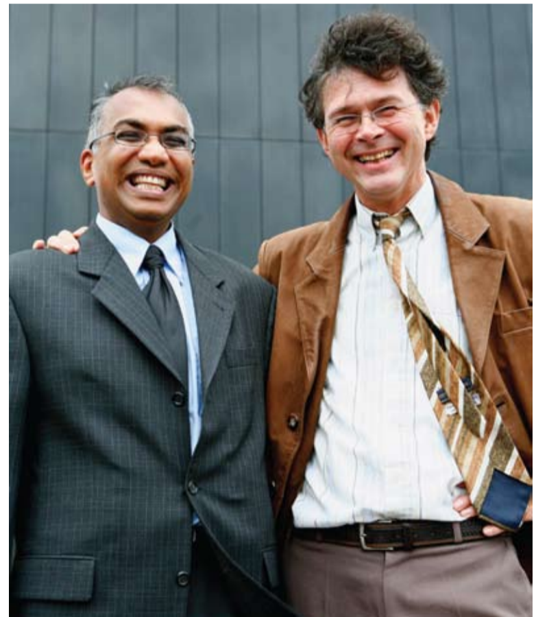
De verheugde ondertekenaars van de overeenkomst