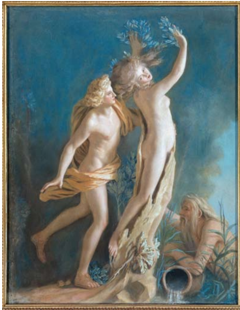
Bernini, Apollo en Daphne. Daphne verandert in een boom om te ontsnappen aan Apollo. Naar aanleiding van Ovidius' Metamorfosen .

De studiedag leverde geen definitief antwoord op de vraag of Google wel geschikt is voor de wetenschappelijke wereld. Maar wel bleek opnieuw dat Google in de commerciële markt een zeer belangrijke plek inneemt en dat bijna iedere zoekmachine, ook de wetenschappelijke, met Google wordt vergeleken. (LS)