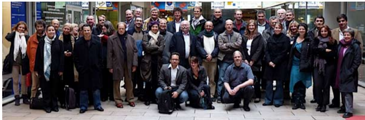
Groepsfoto van de conferentiegangers in Parijs

Op 19 en 20 oktober vond in Parijs een consortiumbijeenkomst plaats van het project DARIAH, Digital Research Infrastructure for the Arts and Humanities. Doel van het project is de bouw van een 'digitale werkbank' voor alfawetenschappers in Europa. Onderzoekers kunnen straks bij DARIAH terecht voor het vinden van data en tools, het archiveren van hun data, kennisuitwisseling en advies op het gebied van metadata en digitalisering.