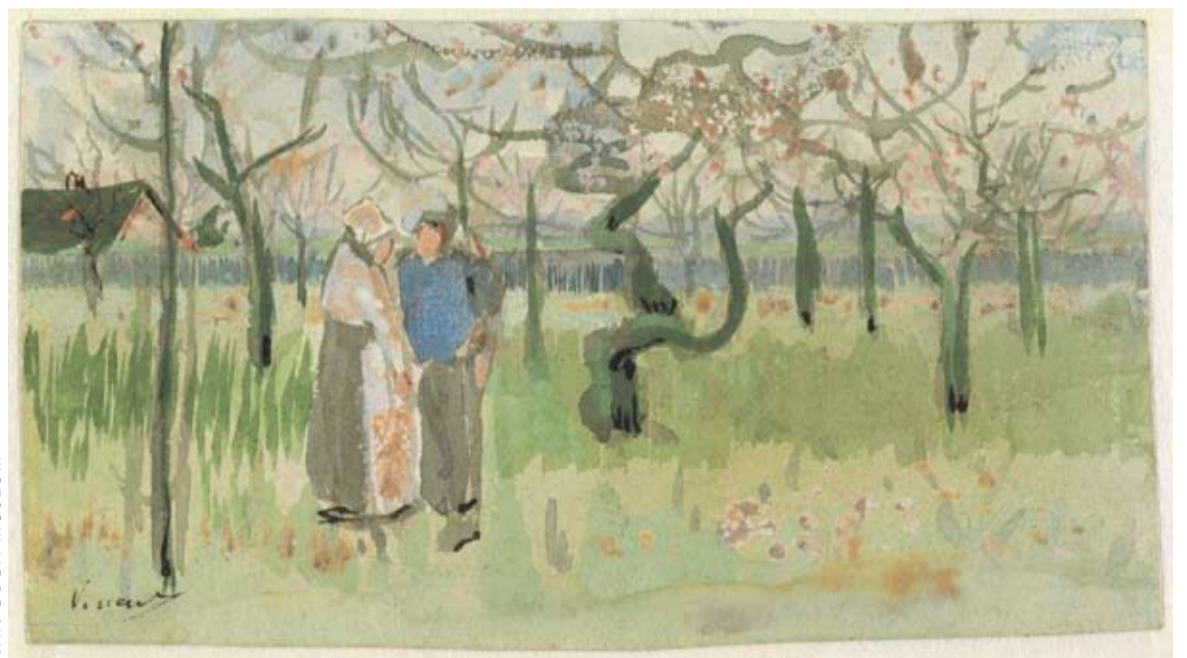
Aquarel die van Gogh bijsloot bij brief 271: Bloeende boomgaard met paartje: lente.

De brieven worden aangeboden in hoge resolutie facsimile maar ook als tekstbestanden in Nederlands en Engels, in verschillende vormen en steeds voorzien van uitvoerige annotaties en verantwoording. Ze zijn volledig doorzoekbaar en bevatten links naar alle schilderijen en kunstenaars waarnaar de brieven verwijst. Daardoor zijn de gebruiksmogelijkheden en informatie zo compleet dat wetenschappelijk medewerker Hans Luijten van het museum tegenover e-data@research de bewering aandurfte: 'Ik zou niet weten wat wij op dit moment nog meer aan kunnen bieden'. Huygens-directeur Henk Wals ziet zulke mogelijkheden wel, maar dan in de sfeer van toegevoegde faciliteiten. 'Je zou er nog analyses van Van Goghs taalgebruik aan toe kunnen voegen of informatie over de plek waar hij zich op zeker moment bevond. We staan