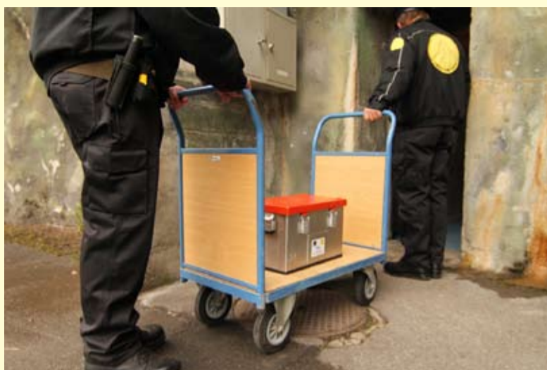
Zware jongens kwamen eraan te pas om de capsule atoomvrij op te bergen.

Persbureau Reuters pikte het bericht op en maakte zelfs een videoreportage waarin wordt gesproken van een 'zero-risk facility'. Om het 007-gehalte nog wat op te schroeven gaf het persbureau in de video aan dat het de