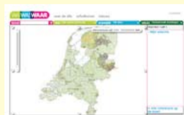
Openings scherm WatWasWaar

zoekt daarom volop naar nieuwe deelnemers, want ze zijn nog lang niet klaar met hun avontuur. (Ivo Gorissen)