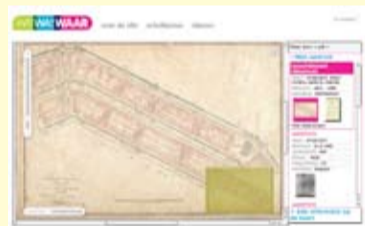
Amsterdam grachtengordel, Kadasterkaart 1832

te maken. Het richt zich op een eerste kennismaking met het materiaal via watwaswaar.nl en een gerichte doorverwijzing naar gedetailleerde informatie van andere erfgoedinstellingen zoals musea en bibliotheken. WatWasWaar zoekt daarom de samenwerking op met organisaties als het Geheugen van Nederland en het instituut Beeld en Geluid. Hoog op de verlanglijst staat ook om de Atlas van Willem Blaeu uit de zeventiende eeuw van het Regionaal Archief Leiden op de website te zetten. Mede geïnspireerd door de kortgeleden bezochte conferentie Museums on the Web in Canada barst de projectgroep van de nieuwe ideeën. 'Wat bijvoorbeeld straks mogelijk zou kunnen zijn', vertelt Job enthousiast, 'is dat je de WatWasWaar-informatie koppelt met je TomTom en je via je navigatiesysteem informatie krijgt over interessante historische gebouwen die je passeert. Maar dat is nog toekomstmuziek. Op kortere termijn zijn we op zoek naar een koppeling met Google Earth en met het ontwikkelen van een API (Application Programming Interface - IG) die ervoor zorgt dat je de kaartinformatie op je eigen website gebruikt waarna je er zelf toepassingen mee kunt maken.' Aan ideeën geen gebrek dus. WatWasWaar