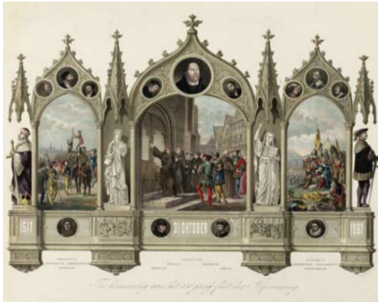
Negentiende-eeuwse prent 'ter herinnering aan het 350-jarig feest der Hervorming' van A.B.H. Braakensiek uit het UBA-archief.

Bij de UBA bestond een groeiende zorg over het behoud van de grote hoeveelheden moeder-images , die op verschillende plaatsen en op verschillende dragers werden bewaard. Er was behoefte aan een centrale en veilige opslag van dit materiaal, bestaande uit hoge resolutiescans die vooral voor reproductiedoeleinden worden gebruikt. Vanwege de daar aanwezige expertise op het gebied van digitale archivering is besloten de