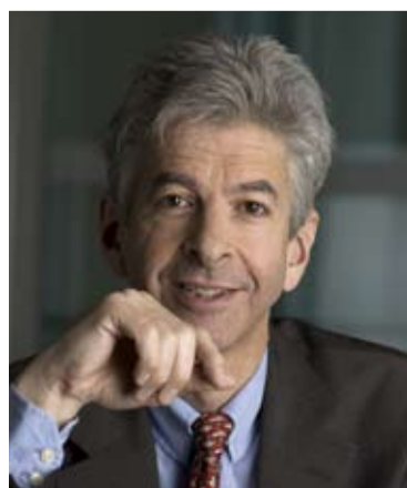
Minister Plasterk, verantwoordelijk voor de voorwaarden voor beleidsgericht onderzoek

modelovereenkomsten bedoeld zijn voor gebruik door alle departementen. DANS is nog in gesprek met het ministerie van OCW over de praktische uitwerking van het verplicht deponeren. (MdG)