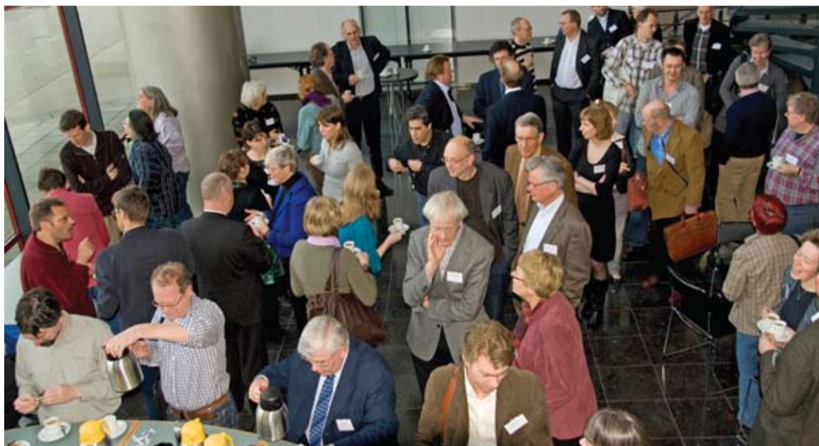
Koffie tijdens het levenslopesymposium

In Amsterdam presenteerden diverse wetenschappers hun onderzoeksbevindingen op basis van een eerste release van twintigduizend levenslopen. Historici, demografen en sociologen gebruikten de nieuwe data om interessante vragen te beantwoorden over levenslopen van de Nederlandse bevolking in de 19e en 20e eeuw. Interessant was daarbij om te zien hoe met verschillende methoden en invalshoeken naar inzicht werd gezocht in factoren die van invloed zijn op de kans om in sociale klasse te stijgen. De Nijmegen historicus Onno Boonstra liet in zijn presentatie zien dat de