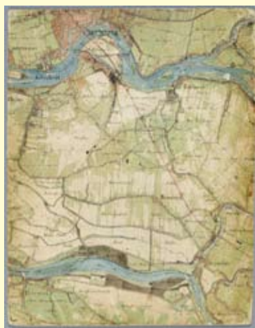
Militaire kaart Bijerland 1850

'Historische informatie over elke plek in Nederland'. Dat biedt de website WatWasWaar, product van samenwerking tussen een groot aantal erfgoedinstellingen. 'Het WatWasWaar-avontuur begon in 2005 met het ontwikkelen van een toegankelijke manier om de oudste kadasterkaart van Nederland te ontsluiten' aldus Job Gerlings van WatWasWaar. Deze kadasterkaart uit 1832 was kort daarvoor gedigitaliseerd. Het bleek een lastige klus om deze toegankelijk te presenteren. En dus werd er een projectgroep aan het werk gezet om deze en andere kaarten gebruikersvriendelijk op het internet te zetten.