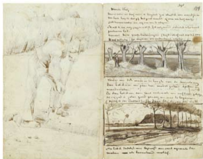
Brief van Vincent van Gogh aan Theo van Gogh (met 3 schetsen), Van Gogh Museum, Amsterdam