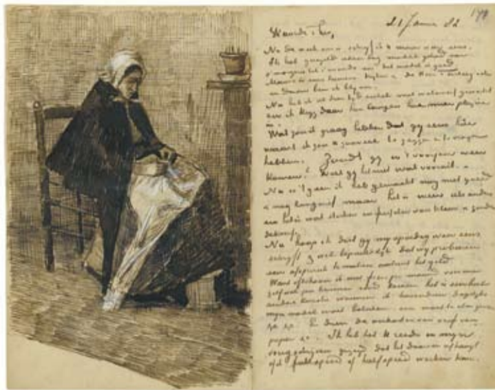
Brief van Vincent van Gogh aan Theo van Gogh (met 1 schets), Van Gogh Museum, Amsterdam

In oktober 2009 zullen de uitkomsten van dit onderzoek worden gepresenteerd in een reeks van activiteiten en publicaties. Een rijk geïllustreerde gedrukte editie verschijnt in het Nederlands, Frans en Engels. Daarnaast komt er een wetenschappelijke digitale editie uit, eveneens een gezamenlijk project van het Van Gogh Museum en het Huygens Instituut. In deze web-editie worden naast de geannoteerde tekst ook de digitale facsimile's van alle brieven opgenomen en uitgebreidere annotaties dan in de gedrukte uitgave mogelijk is. Resultaten van het onderzoek zullen ook te zien zijn in een tentoonstelling in het Van Gogh Museum, waarin de kunstenaar zelf aan het woord komt. De bezoeker kan zien wat Vincent