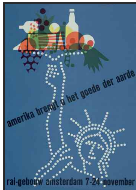
Uitingen zoals dit affiche uit 1963 beïnvloeden de beeldvorming over Amerika

keken tegen de producten, praktijken en ideeën die met de Verenigde Staten werden geassocieerd. De VS zijn daarbij een voorbeeld van een 'referentiecultuur': een cultureel model dat al dan niet geïmiteerd wordt