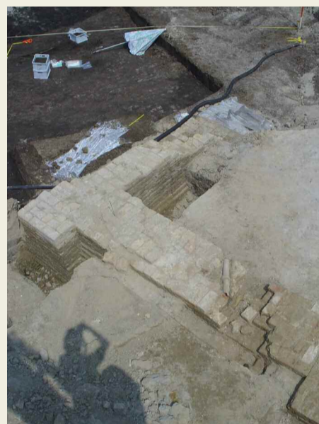
Baksteenfundering van de toren en de westmuur van de middeleeuwse kerk

Deze bestanden zijn kosteloos beschikbaar via www.lissdata.nl/dataarchive . Bezoek deze site of scan de QR-code