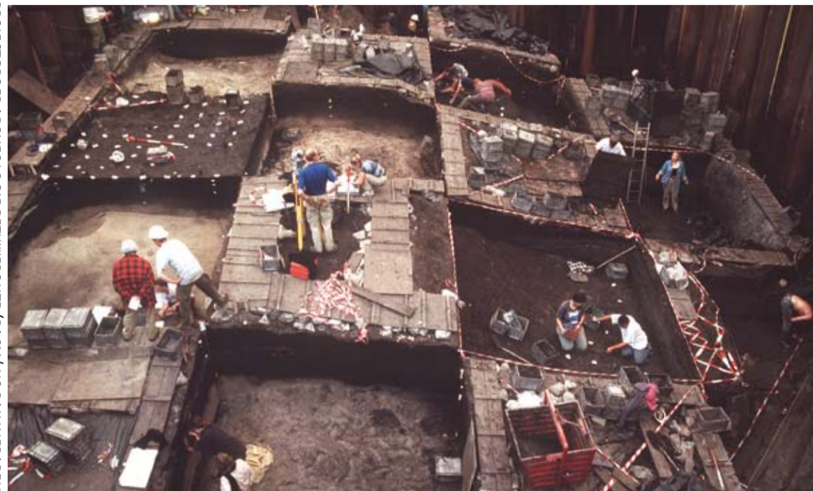
PROJECTGROEP ARCHEOLOGIE BETUWELIJN (RACM/ NS RALUINFRABEHEER) Een grote groep archeologen heeft werk gevonden in de commerciële archeologie, zoals hier voor de aanleg van de Betuwelijn.

Tegelijkertijd kampen de universiteiten de laatste jaren met teruglopende formatieruimte en toenemende studentenaantallen. Kennis en ervaring van de afgestudeerden zijn daardoor minder dan de nieuwe werkgevers verwachten. Ook het onderzoek aan de universiteiten komt steeds meer onder druk te staan. Juist daar moeten de vele losse waarnemingen van Malta-onderzoek worden vertaald naar een samenhangend beeld over ons verleden. Oogst van Malta onderzoek is door de beperkte kwaliteit en beschikbaarheid echt moeilijk en kan, zeker als de